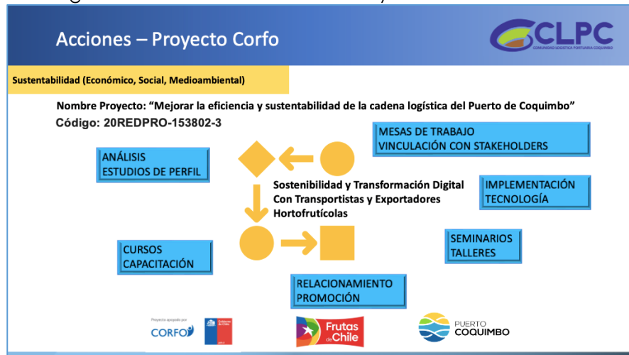
Figura 5: Resumen de Acciones Proyecto Corfo 2021- 2023