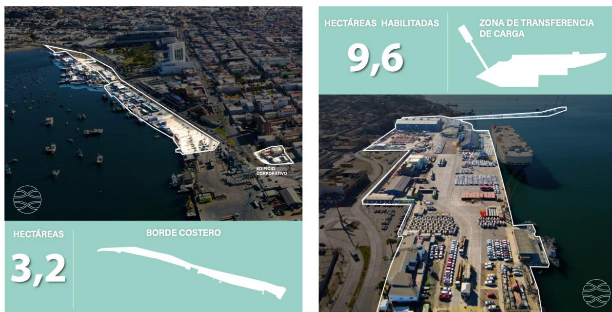
Figura 2: Áreas de Empresa Portuaria Coquimbo