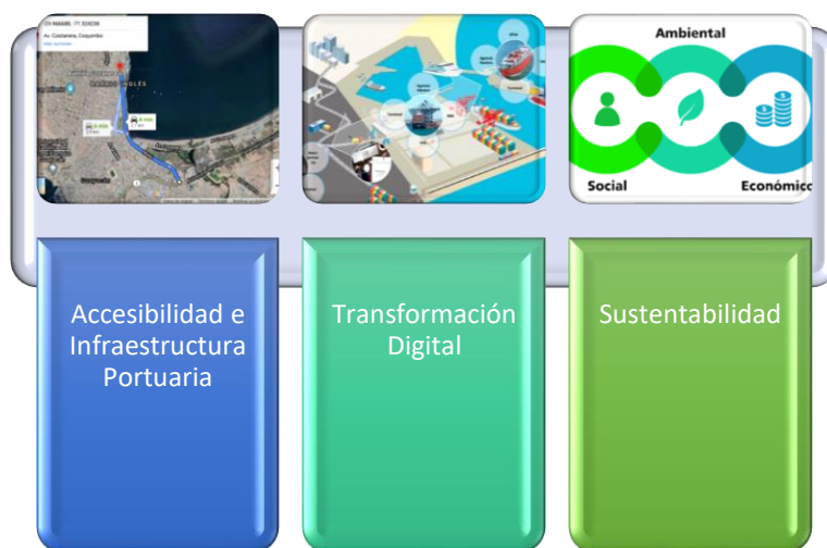
Figura 3: Pilares Fundamentales CLPC

La base de la planificación estratégica se centra en optimizar la cadena logística portuaria para impulsar el crecimiento económico y social de la región de Coquimbo, al mismo tiempo que se minimiza el impacto ambiental. A continuación, se presentan los pilares de CLPC en la Figura 3.